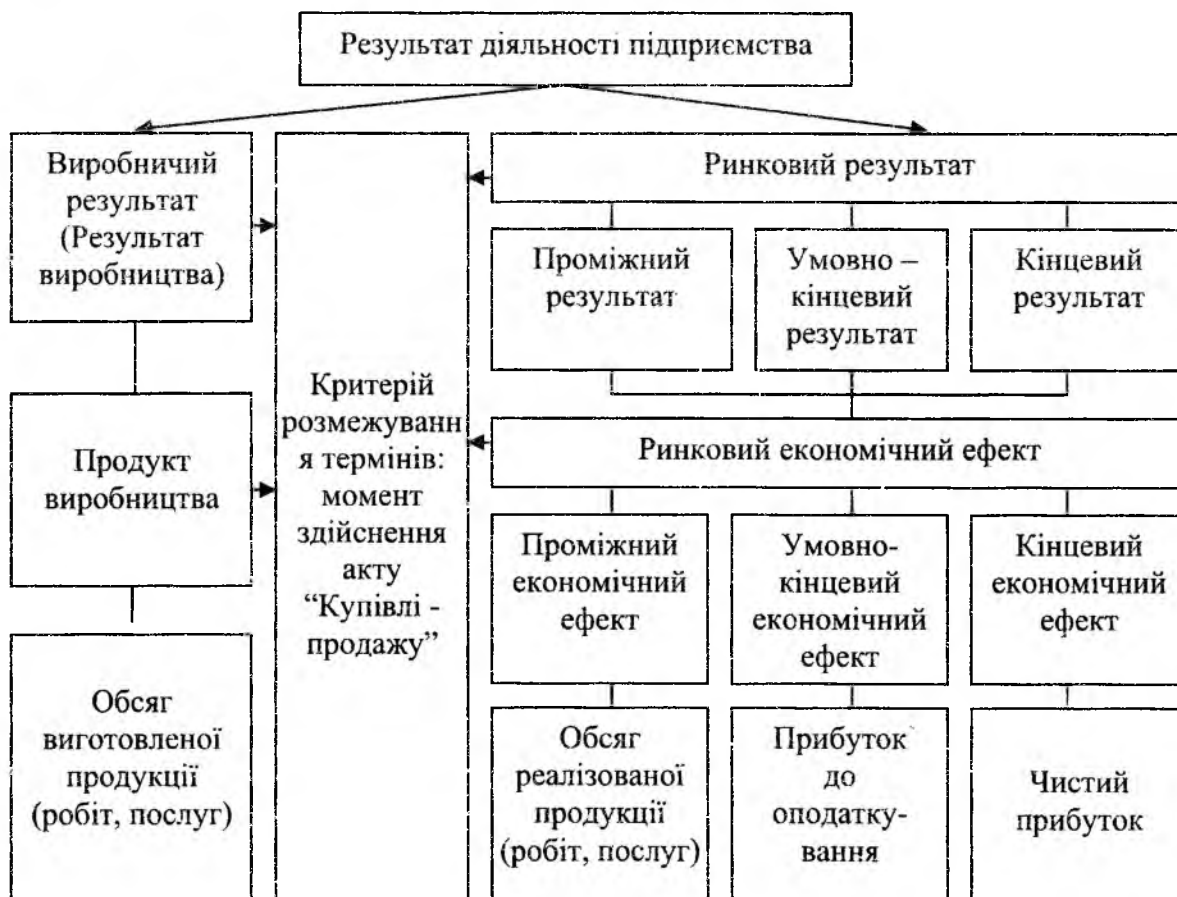
Рис. 1. Загальна схема формування різних видів результату діяльності підприємства.

Методологія формування цих показників залежить від економічного змісту їх чисельників і знаменників. Розглянемо спочатку методологічні засади формування чисельників показників, що досліджуються (рис. 1).