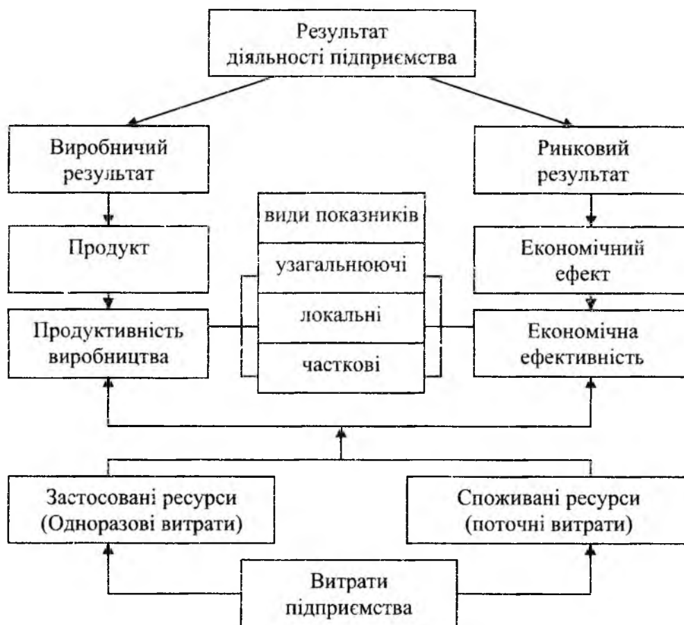
Рис. 2. Методологічні засади формування показників результативності, ефективності й продуктивності.

Схема наведена на рис. 1 дозволяє логічно перейти до розкриття економічного змісту і формування показників результативності, ефективності і продуктивності, що показано на рис. 2 і 3.