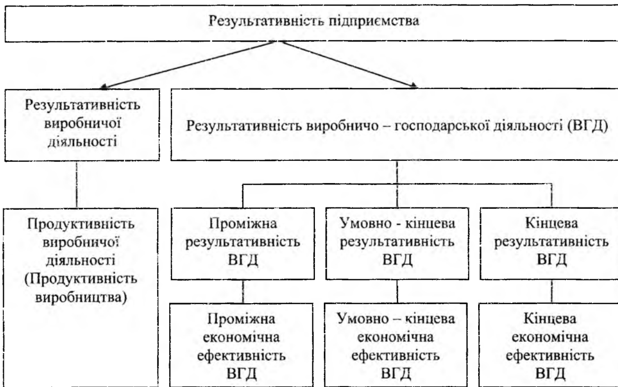
Рис. 3. Схема взаємозв'язку і визначення сутності показників результативності, ефективності і продуктивності

Узагальнюючі показники економічної ефективності діяльності підприємства сформовані згідно класифікації видів ринкового економічного ефекту (рис. 3).