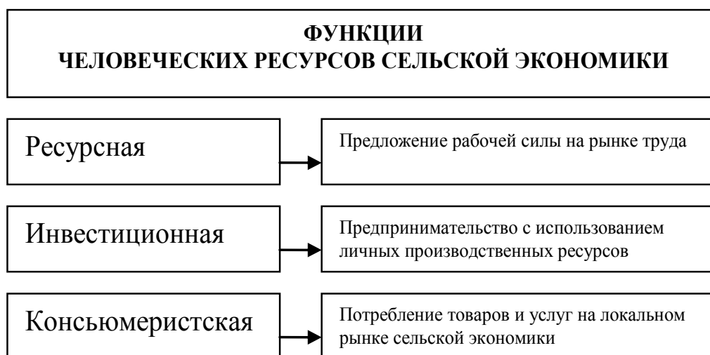
Рис. 1. Функциональная направленность человеческих ресурсов сельской экономики [1, с. 96-99]

капитал сельской семьи, создающий основу для экономического воспроизводства в сельской экономике, посредством упомянутых механизмов вовлечения. На рис. 1 представлены три функции человеческого капитала в сельской экономике, предопределяющего как направления использования, так и возможности увеличения потенциала на перспективу.