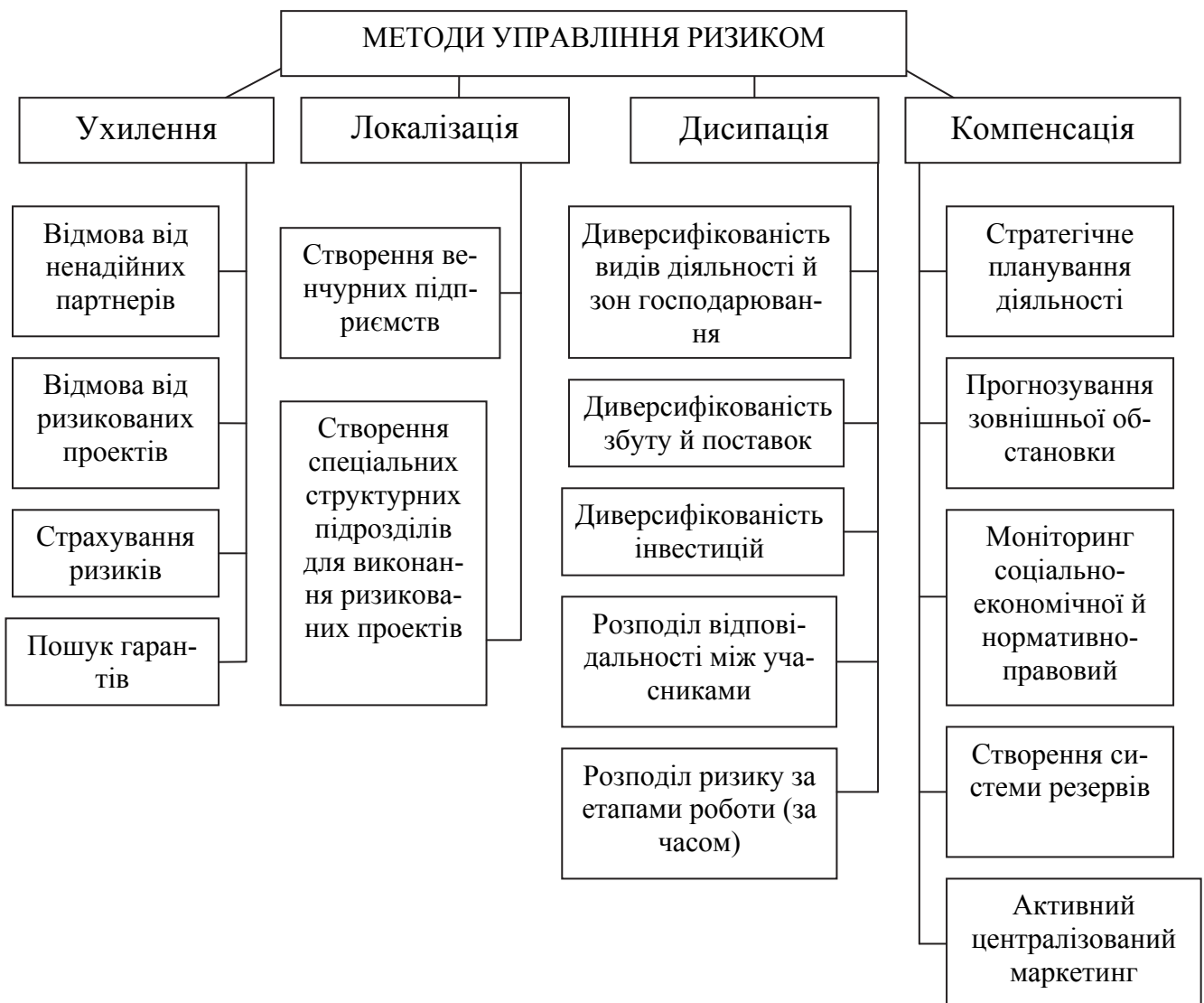
Рис. 1 Методи управління ризиком

Найдієвішим способом ухилення від інноваційних ризиків є їх страхування, що являє собою систему відносин по передачі певних ризиків підприємства страховій компанії (страховикові).