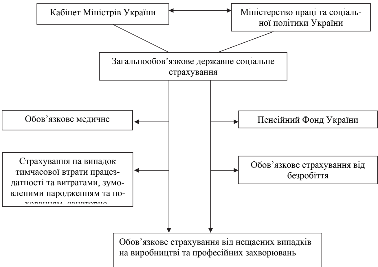
Рис. 2. Загальна схема управління фондами загальнообов'язкового державного соціального страхування в Україні

Загальну схему управління фондами загальнообов'язкового соціального страхування наведено на рис 2.