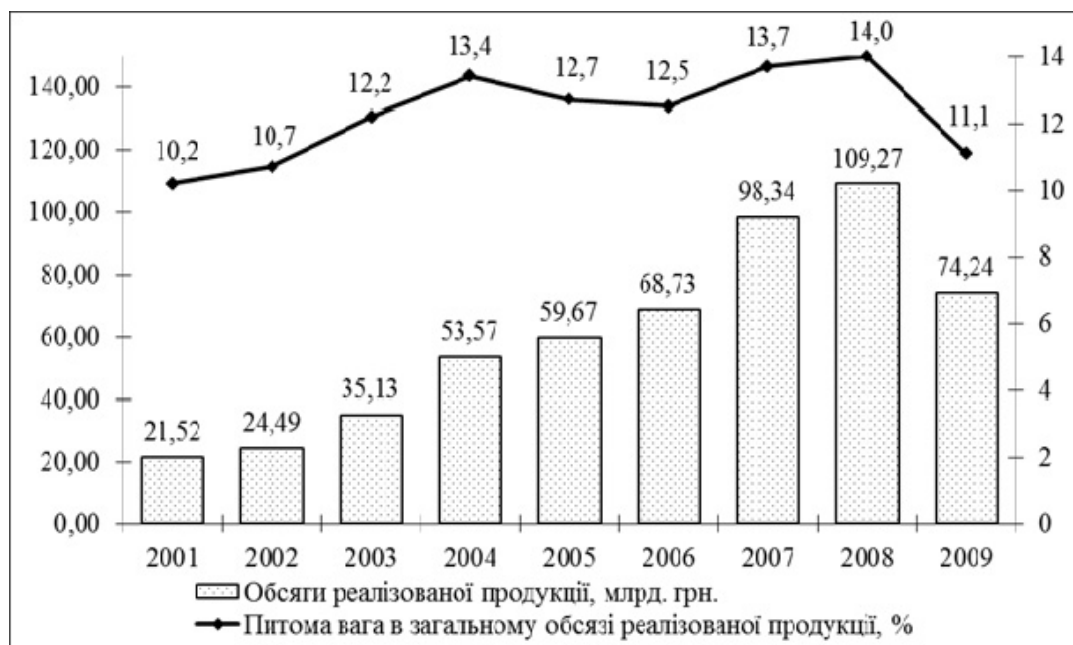
Рис. 1. Обсяги реалізованої продукції машинобудування в Україні за 2001 – 2009 роки [9, с. 108]

Одним з показників, що відображає відсутність позитивних зрушень у досліджуваній галузі, є зміна у часі питомої ваги продукції машинобудування в загальному обсязі реалізованої продукції в Україні протягом першого десятиріччя XXI століття (рис. 1).