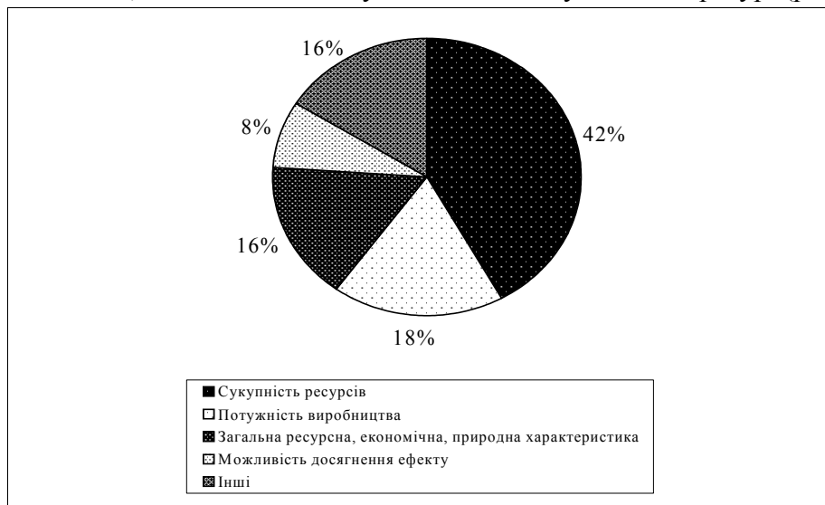
Рис.1. Класифікація ознак поняття «потенціал» за Н.Т.Ігнатенко та В.П.Руденко

Цікавою щодо цього є запропонована Н. Т. Ігнатенком та В. П. Руденком класифікація ознак поняття «потенціал», загальноновживана у вітчизняній науковій літературі (рис. 1.).