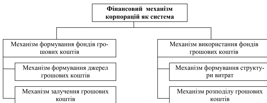
Рис. 3 - Фінансовий механізм як система формування і використання грошових коштів корпорації

Досліджуючи фінансовий механізм з погляду функцій фінансів корпорацій і застосовуючи положення фундаментальної теорії фінансів, його можна представити як механізм формування фондів грошових коштів і механізм використання цих фондів (рис. 3).