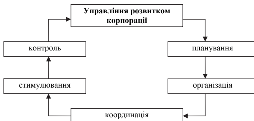
Рис.1 – Цикл управління як процес взаємозв'язаних функцій

сів і керованих об'єктів. Реалізація функцій управління - це цикл управління як процес взаємозв'язаних функцій (рис. 1).