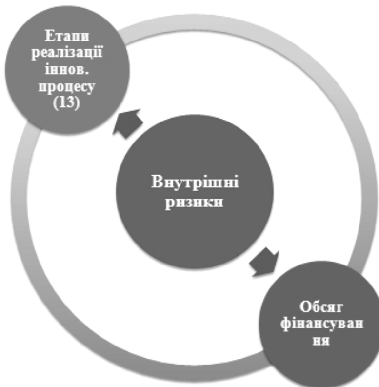
Рис. 3 Фактори внутрішніх ризиків