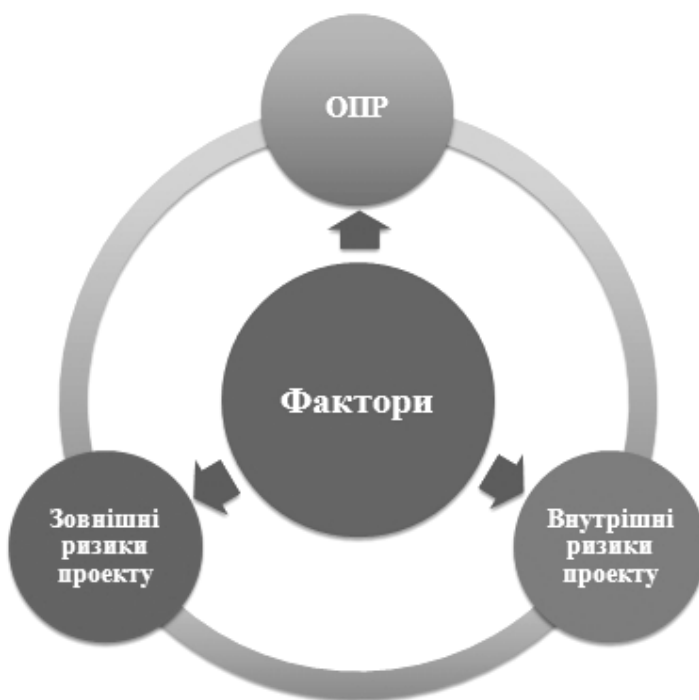
Рис. 1. Групи факторів, які впливають на фінансування інноваційного проекту

Можливо говорити, що на формування проекту, і особливо на вирішення питання його фінансування, впливає безліч різних факторів, основні з яких пов'язані із: зовнішніми ризиками, які визначаються загальною економічною й політичною ситуацією; внутрішніми - технічні, технологічні та організаційні ризики; ризики пов'язані з якостями особистості людини, яка приймає рішення щодо фінансування проекту (рис. 1).