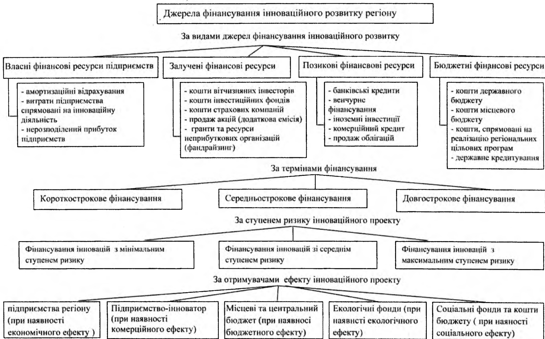
Рис 5. Класифікація джерел фінансування інноваційного розвитку регіону