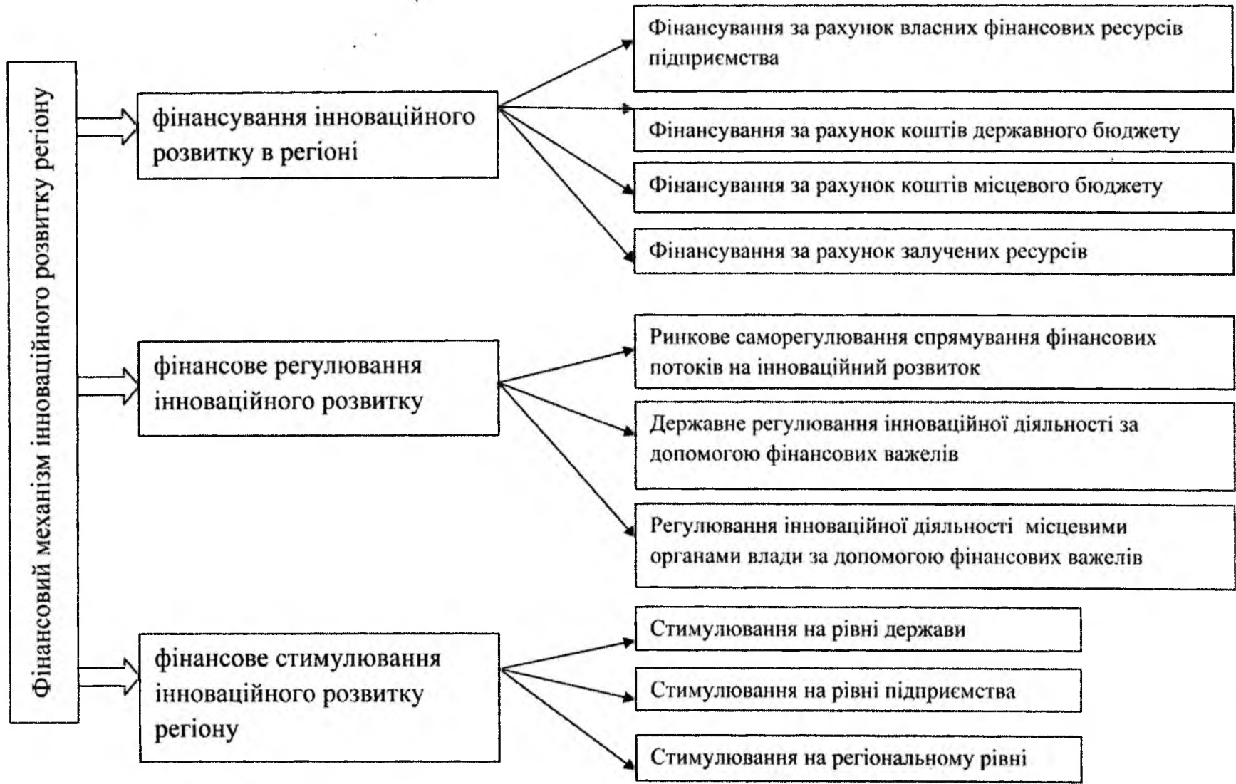
Рис.2. Структура фінансового механізму інноваційного розвитку регіону