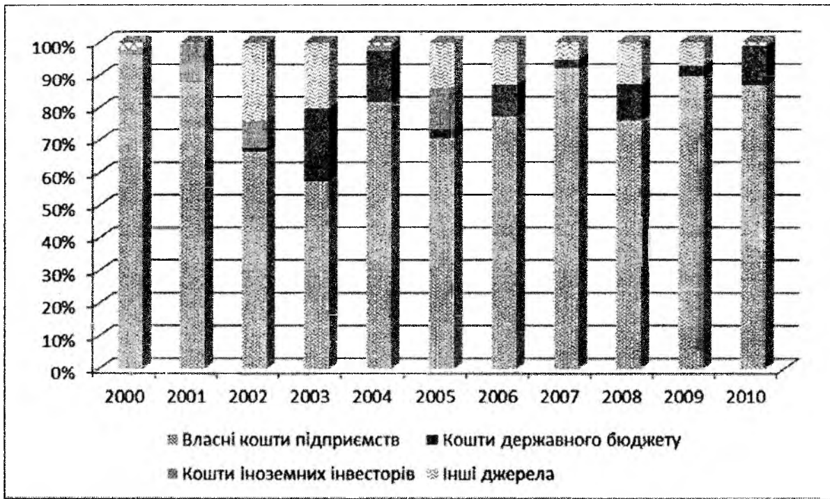
Рис. 4. Розподіл джерел фінансування інноваційної діяльності в Дніпропетровській області з 2000 по 2010 роки

Також слід відмітити, що дієвий фінансовий механізм не можливий без фінансового регулювання та стимулювання інноваційного розвитку регіону. Універсальними інструментами регулювання інноваційного розвитку слід вважати податки, відрахування, дотації та субсидії [5]. Найбільш поширеним фінансовими стимулами вважаються пільгове кредитування, податкові пільги, виплата компенсацій. До методів державної підтримки розвитку інновацій відносять дотаційне фінансування, створення сприятливого інноваційного клімату, податкові та кредитні пільги, страхування інноваційних ризиків [6].