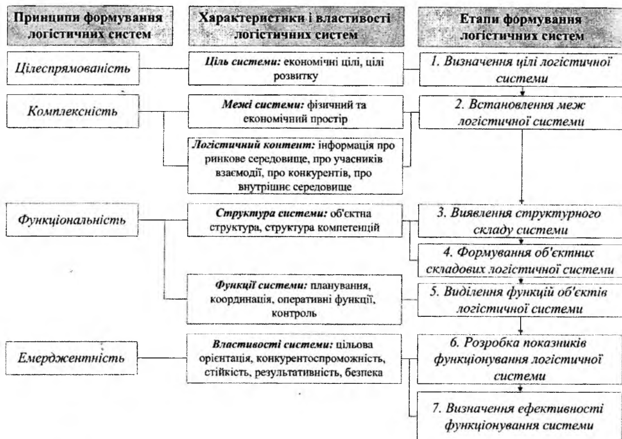
Рис. 1. Взаємозв'язок принципів, характеристик і етапів формування логістичних систем

З динамічністю розвитку ринкових відносин і ускладненням управління соціально-економічними процесами об'єктивно з'являється необхідність у встановленні тривалих відносин між учасниками економічної діяльності, що зумовило появу сітьової форми організації логістичної діяльності [7]. Проявом сітьового підходу в логістиці є активізація діяльності в економіці по формуванню логістичних сітей.