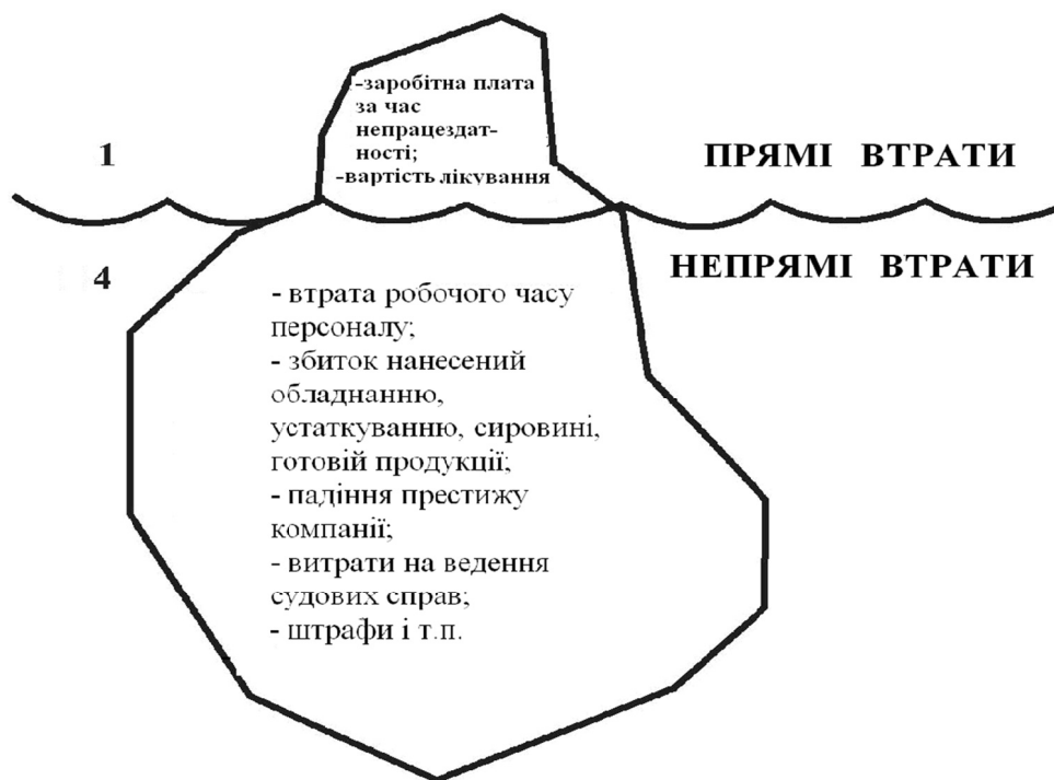
Рис. 1. «Айсберг» прямих і непрямих втрат внаслідок нещасного випадку [5]

Х. В. Хайнріх звертав увагу на той факт, що значне число травм на виробництві не приводить до втрати здоров'я і створив так звану «теорію піраміди» (рис. 2), відповідно до якої на один нещасний випадок з втратою працездатності приходиться безліч дрібних, які не призводять до пропуску роботи [5].