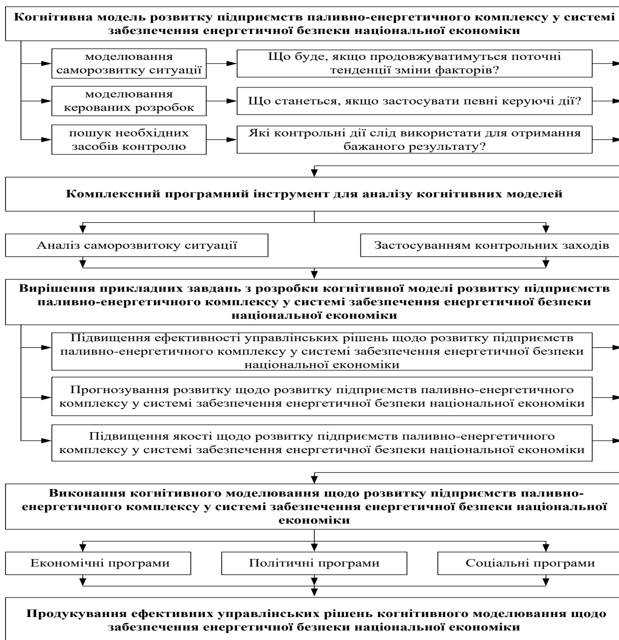
Рис. 2. Науково-практичний підхід продуктування ефективних управлінських рішень когнітивного моделювання щодо забезпечення енергетичної безпеки національної економіки

За допомогою когнітивної моделі розвитку підприємств паливно-енергетичного комплексу у системі забезпечення енергетичної безпеки національної економіки, складеної таким чином, і визначення двох підмножин у всьому наборі факторів: «контролюючих» і «спостережуваних» факторів, ми можемо вирішити такі проблеми, які наведено на рис. 2.