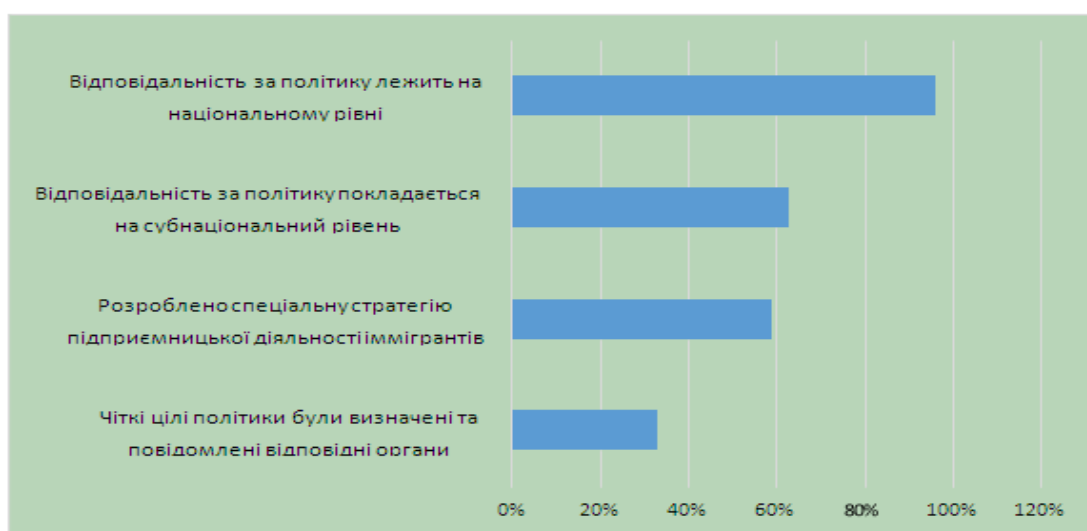
Рис. 1. Політика молодіжного підприємництва після фінансової кризи (частка країн-членів ЄС, 2020 р.)*

Політика молодіжного підприємництва є досить розвинутою порівняно з підтримкою підприємництва для інших інклюзивних цільових груп підприємництва (наприклад, людей похилого віку, іммігрантів). Експерти ОЕСР [10] в державах-членах ЄС, досліджували підходи до просування та підтримки інклюзивного підприємництва, включно з молодіжним підприємництвом. За результатами цих досліджень встановлено, що майже дві третини держав-членів ЄС мають конкретну стратегію молодіжного підприємництва (рис.1).