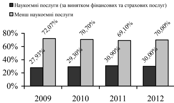
Рис. 2. Динаміка наукоємних послуг в Україні. Розраховано автором за [8; 9]

Відповідно до наведеної класифікації нами було розраховано рівень наукоємності реалізованих послуг в українській економіці та представлено динаміку даного показника за період 2009–2012 рр. (Рис. 2).