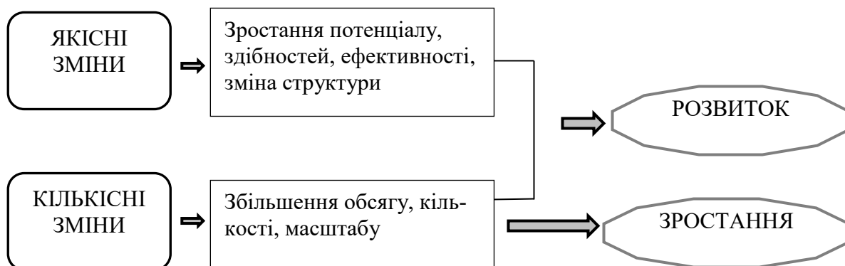
Рис. 1. Відмінність між поняття «розвиток» та «зростання».

які вказують на прогрес в економіці держави в цілому. Зростання ж характеризується тільки конкретними показниками в кількісному виразі (рис. 1).