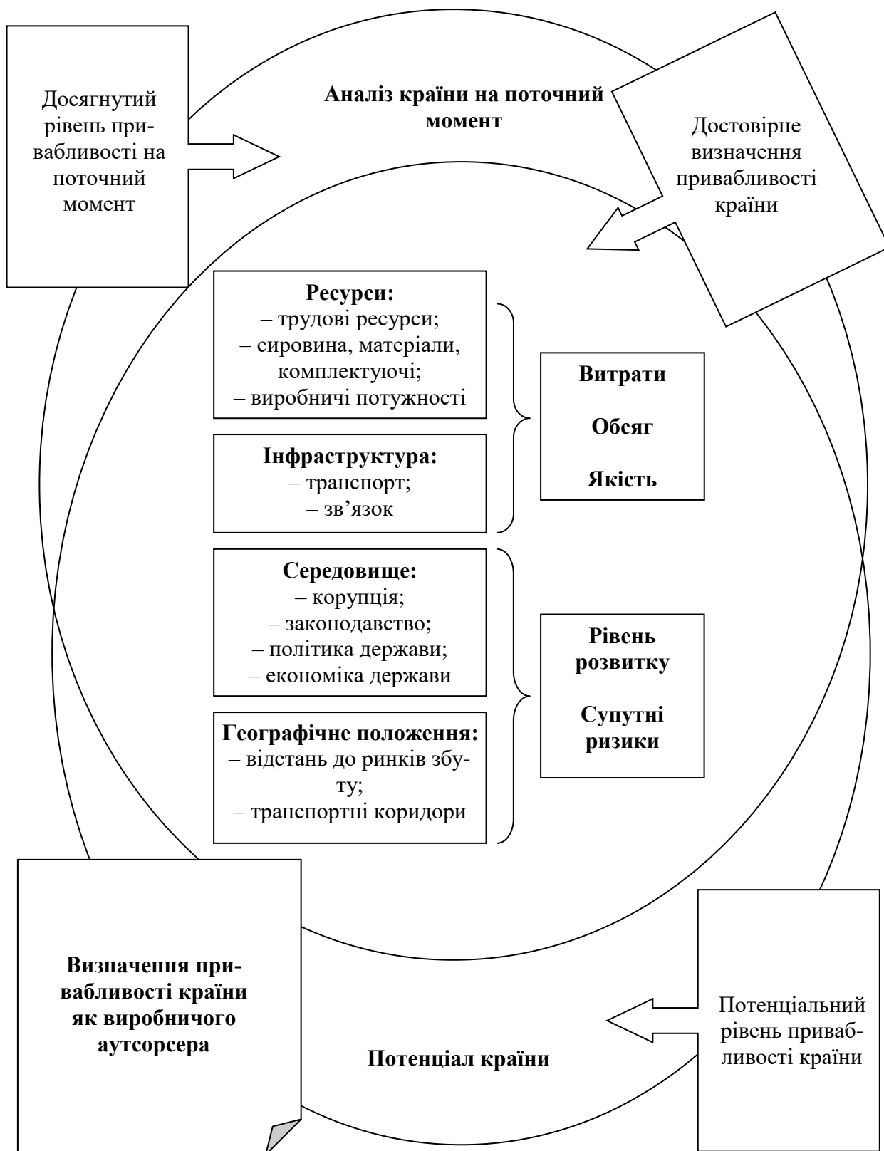
Рис. 1. Схема проведення аналізу привабливості країни в якості виробничого аутсорсера

Оцінка трудових ресурсів дозволяє визначити чи достатньо у підприємства персоналу для виконання аутсорсингових завдань, чи володіє персонал необхідними навичками, досвідом та освітою, чи є потенціал підвищення кваліфікації персоналу, чи схильні