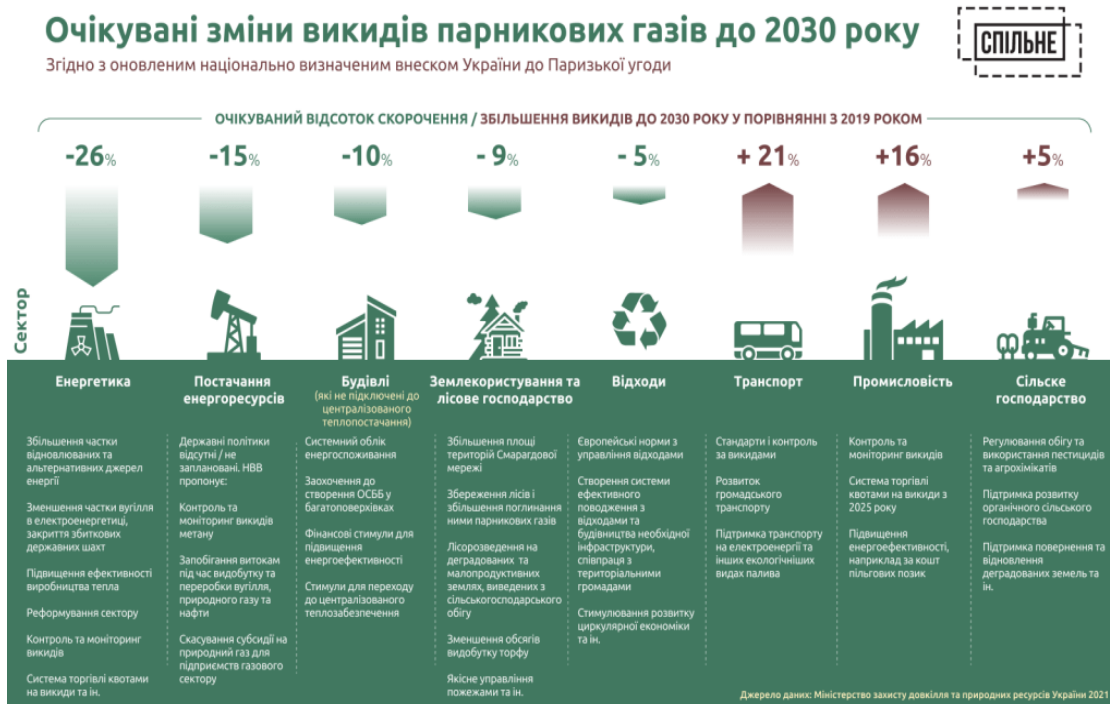
Рис. 10. Динаміка зміни викидів парникових газів в Україні до 2030 року [10]

Відповідно, Україна бере на себе зобов'язання зменшити рівень викидів CO 2 на 7% до 2030 року в порівнянні з доковідним 2019 роком. Тобто програма мінімум – стабілізувати викиди на нинішньому рівні, а програма максимум –трохи їх знизити. Причому по різних секторах економіки стратегія зменшення викидів буде різною (рис. 6).