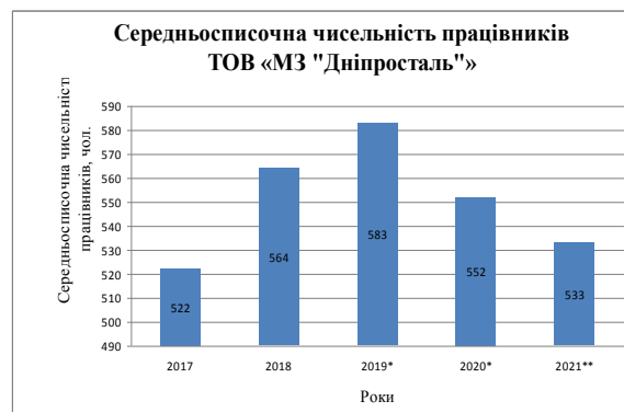
Рис. 2. Динаміка зміни середньосписочної чисельності працівників в умовах ТОВ «МЗ «Дніпросталь» у 2017–2021 рр.