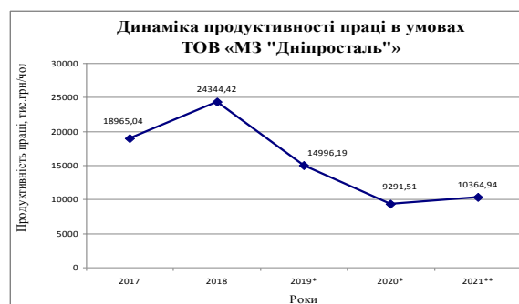
Рис. 4. Динаміка зміни продуктивності праці в умовах ТОВ «МЗ «Дніпросталь» у 2017–2021 рр.

Варто нагадати, що ТОВ «Металургійний завод «Дніпросталь» – це новий високотехнологічний електросталеплавильний комплекс у м. Дніпро. Після завершення будівництва в 2012 році став найбільшим за виробничою потужністю електросталеплавильним комплексом у Європі – 1,32 млн. т