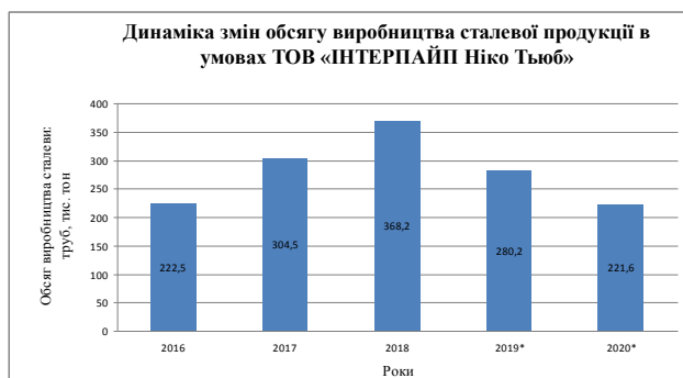
Рис. 5. Динаміка змін обсягів виробництва сталевих труб в умовах ТОВ «Інтерпайп Ніко Тьюб» за 2016–2019–2020 (9 місяців) рр.

Навчання нових кадрів і підвищення кваліфікації відбувається у приміщенні навчального центру IQ 267, місією якого є зміна мислення співробітників, завдяки можливості професійного та особистісного зростання.