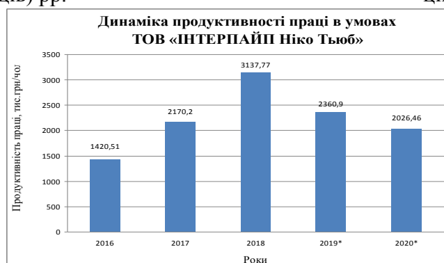
Рис. 9. Динаміка зміни продуктивності праці в умовах ТОВ «Інтерпайп Ніко Тьюб» за 2016–2019–2020 (9 місяців) рр.