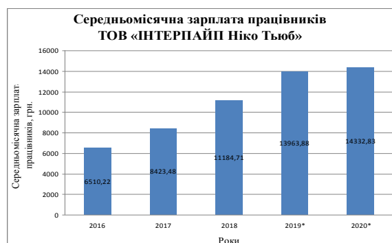
Рис. 8. Динаміка зміни середньомісячної заробітної плати в умовах ТОВ «Інтерпайп Ніко Тьюб» за 2016–2019–2020 (9 місяців) рр.