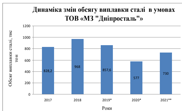
Рис. 1. Динаміка зміни обсягу виплавки сталі в умовах ТОВ «МЗ «Дніпросталь» у 2017–2021 рр.

кон'юнктура на світових сировинних ринках.