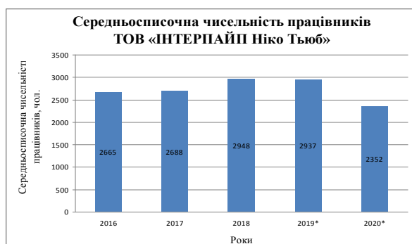
Рис. 7. Динаміка зміни середньосписочної чисельності працівників в умовах ТОВ «Інтерпайп Ніко Тьюб» за 2016–2019–2020 (9 місяців) рр.