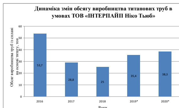
Рис. 6. Динаміка змін обсягів виробництва титанових труб в умовах ТОВ «Інтерпайп Ніко Тьюб» за 2016–2020 (9 місяців) рр.