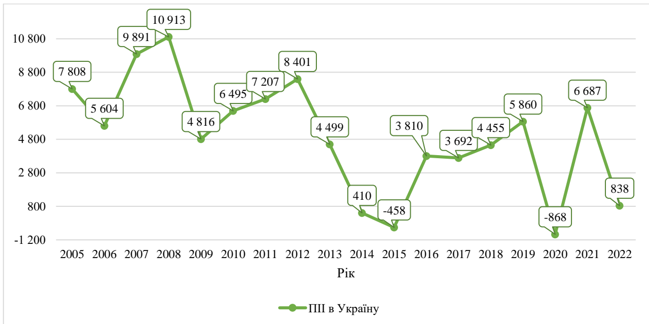
Рис. 1. Динаміка обсягів ПІІ в економіку України за 2005–2022 рр., млн дол.

млн дол. (у тому числі реінвестування доходів – 4 900 млн дол.) (682,6%) більше, ніж у 2021 р. [6].