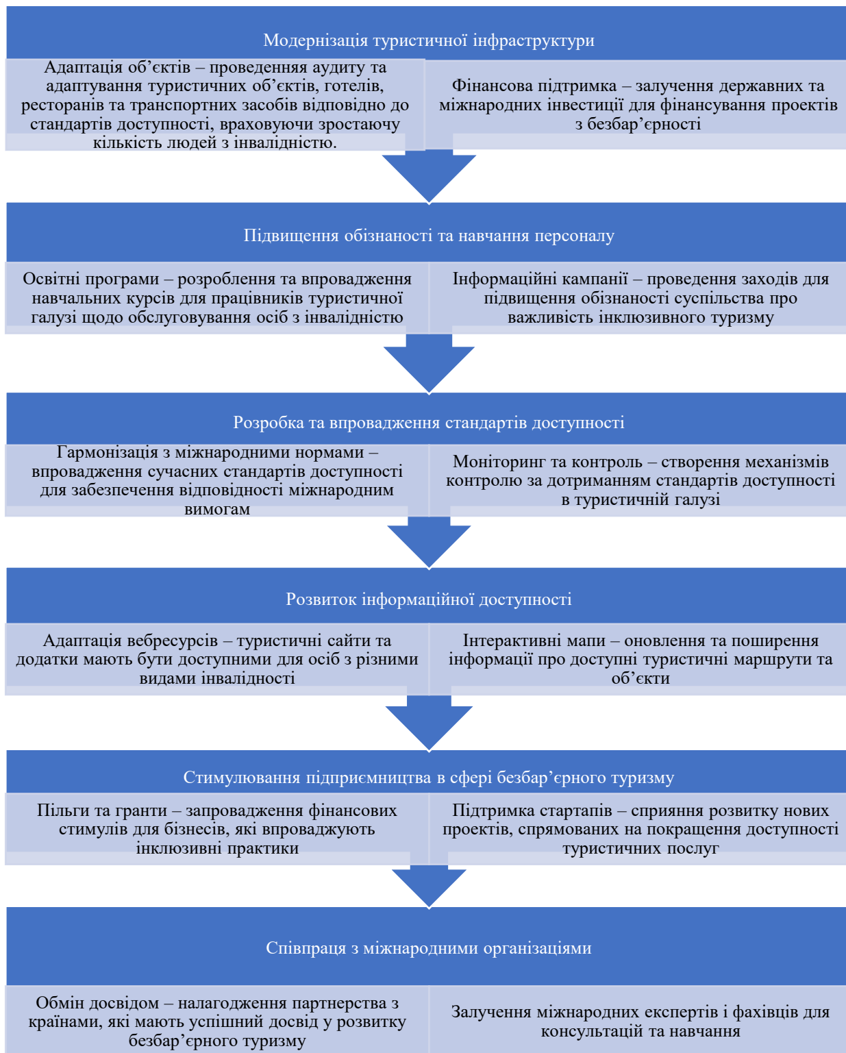
Рис. 2. Рекомендації з розвитку безбар'єрного туризму в Україні

маломобільних груп населення. Дана модель зображена на рис. 2.