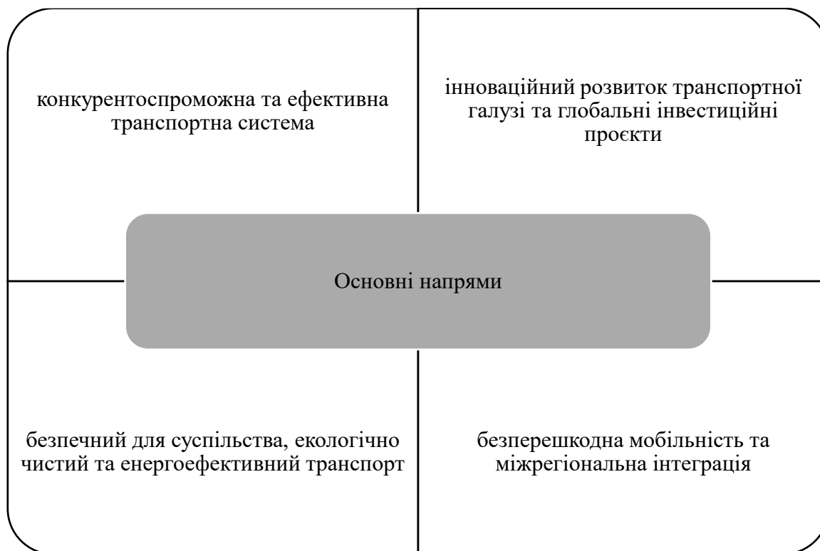
Рис. 3. Основні напрями розвитку транспортної галузі

Важливою складовою цієї стратегії є визначення пріоритетних напрямів інвестування, що забезпечують сталий розвиток галузі та дозволить адаптуватись до сучасних вимог та викликів, сприяючи впровадженню інноваційних технологій, оптимізації використання ресурсів та підвищенню конкурентоспроможності транспортної системи України.